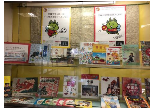
萩山図書館「ようこそ東村山へ」

「中国の美」、「和を知る本」、「食のオリンピック」、「外国から見た日本」、「パラリンピック～障がい者とスポーツ」等