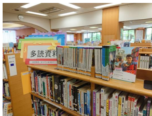
秋津図書館の多読資料コーナー