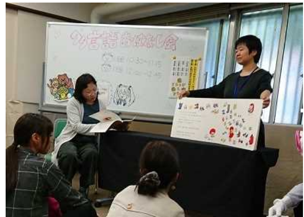
大型絵本を中国語で読み聞かせ