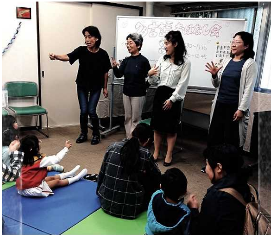
いろいろなことばでじゃんけん

市民相談交流課のイベントに準備段階から協力、韓国出身の市民・中国語教員・英語の話せる読み聞かせボランティア・日本語の読み聞かせボランティアがチームを組んで、読み聞かせだけでなく手遊び、歌遊びなどもとりいれ、好評を得た。