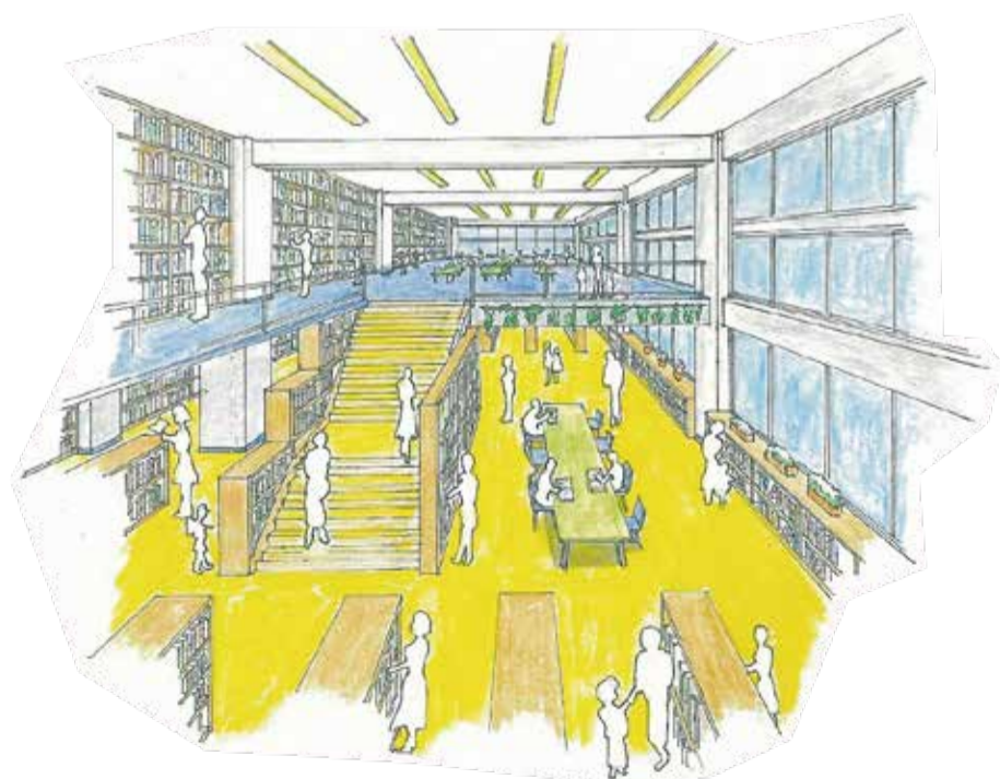
市民の皆さんから伺った意見をもとに作成したイメージです ※決定されたものではありません

市内全小・中学校の築年数、複合化する近隣の公共施設の築年数、児童・生徒数の推計、建物を建てる際の用途制限（用途地域）などを踏まえて、総合的に萩山小学校を1校目とすることが望ましいとの結果にたどり着きました！