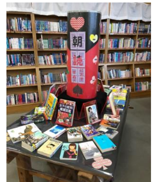
朝読書用おすすめ図書展示